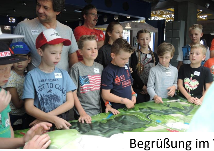
Begrüßung im Werkforum