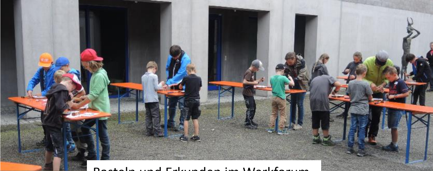
Basteln und Erkunden im Werkforum