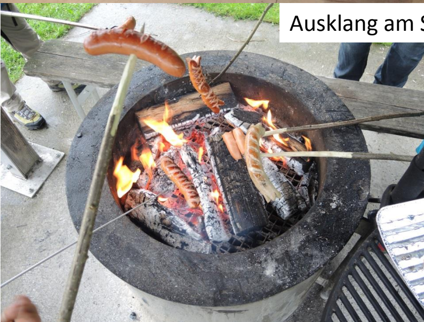
Ausklang am Schiefersee