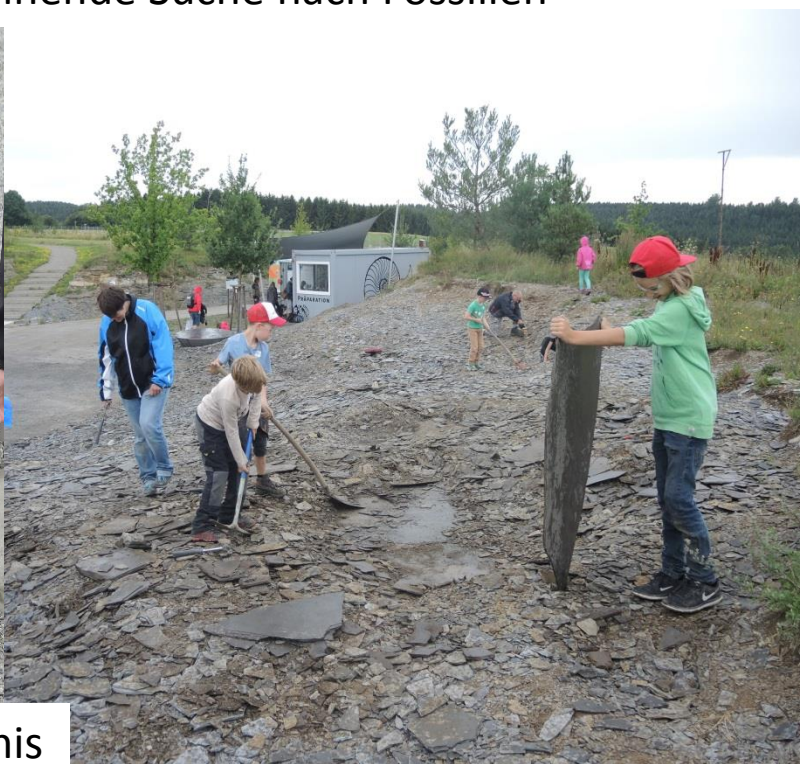
Spiel und Spaß im SchieferErlebnis